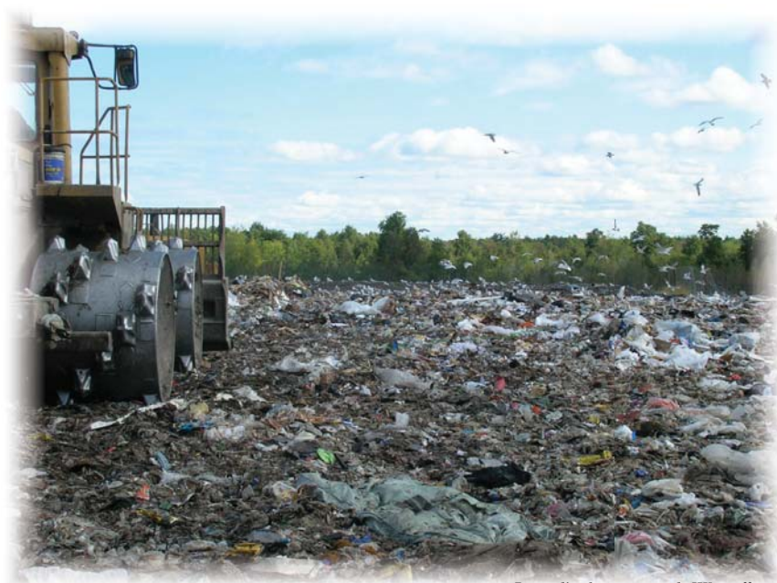
Lieu d'enfouissement de Westville

Le FCQGED a été à l'origine de revendications sociales et environnementales qui ont mené au déclenchement d'une commission d'enquête du Bureau d'audiences publiques sur l'environnement concernant la gestion des déchets au Québec. Commission qui a ultimement établi les bases de la Politique québécoise de gestion des matières résiduelles 1998-2008 et des diverses lois et règlements qui en ont découlé.