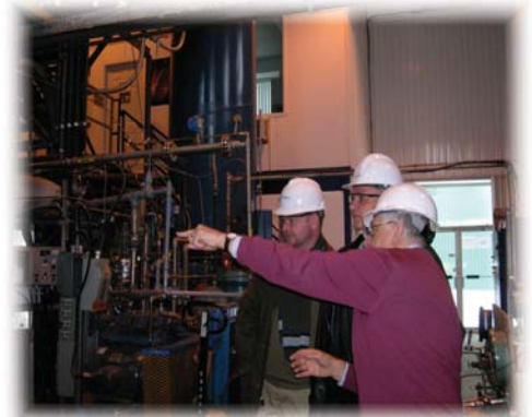
Visite de la compagnie Enerkem

65e anniversaire de l'Association des Brasseurs du Québec (ABQ).