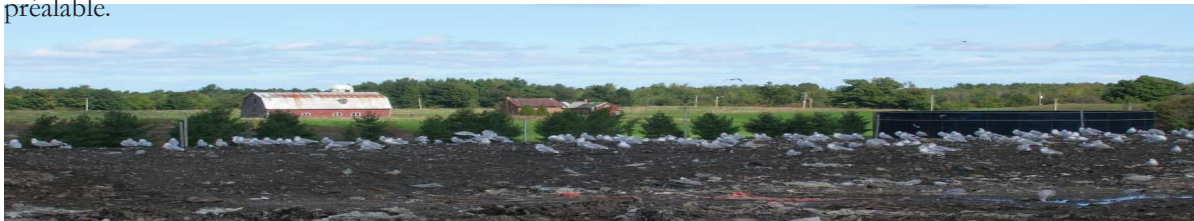
Lieu d'enfouissement de Westville

Quant aux 25 millions de dollars prévus pour la construction d'une plate-forme de transbordement, ils devraient plutôt être investis dans l'implantation d'un lieu d'enfouissement technique sur le territoire de l'île de Montréal. Ce site qui ne devrait recevoir que les matières résiduelles stabilisées et issues d'un tri préalable.