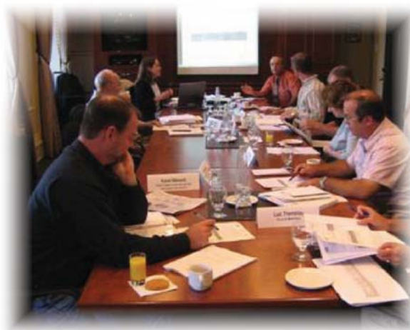
Comité de normalisation (BNQ)

Initiateur: Ministère du Développement durable, de l'Environnement et des Parcs (MDDEP).