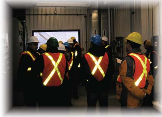
Visite du LET de Sainte-Sophie

Dans certains dossiers plus complexes, l'organisme peut également intervenir directement à la demande de ses membres ou si les enjeux comportent des incidences nationales. Ainsi, le FCQGED déploie ses ressources en intervenant soit par le biais de rencontres d'information ou de travail avec les divers intervenants impliqués. L'organisme peut également décider de prendre position dans certains dossiers notamment par voie de communiqués, de mémoires ou encore par le truchement d'interventions publiques.