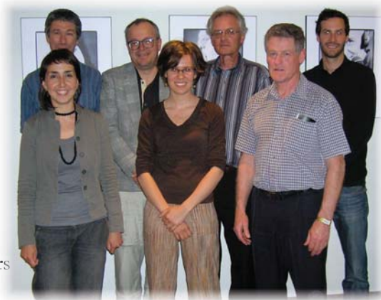
Conseil d'administration 2008-2009