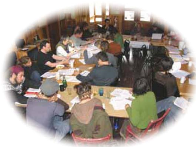
AGA du RQGE 2008

Actif depuis 1982, le Réseau québécois des groupes écologistes (RQGE) est un organisme sans but lucratif qui rallie les groupes écologistes du Québec pour faciliter les communications entre ceux-ci et établir un pont avec les autres acteurs sociaux.